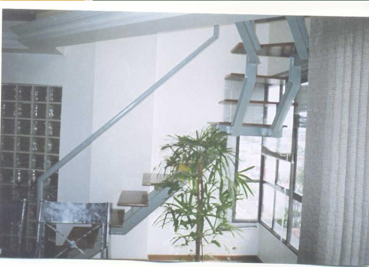
Antes e Depois do Incendio