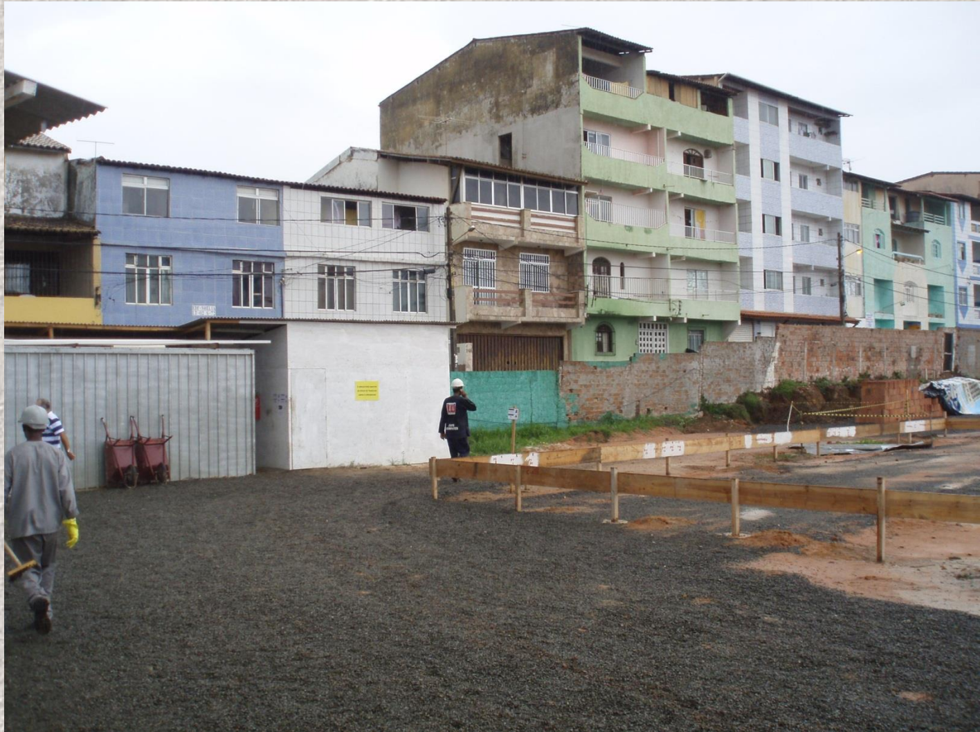
Riscos da vizinhança