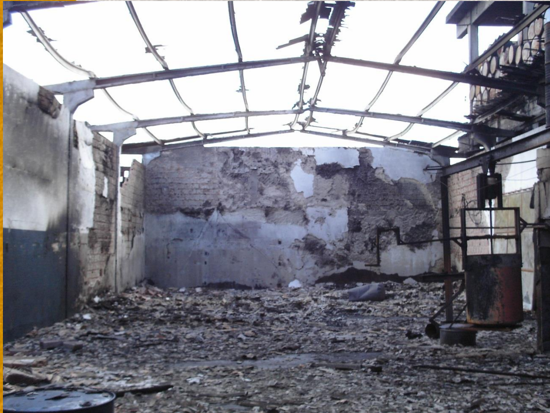
Fábrica de colchões