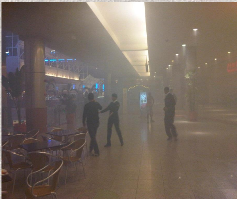
Shopping em Salvador