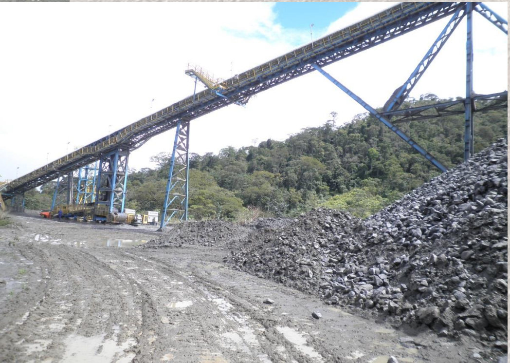
Mina de Níquel