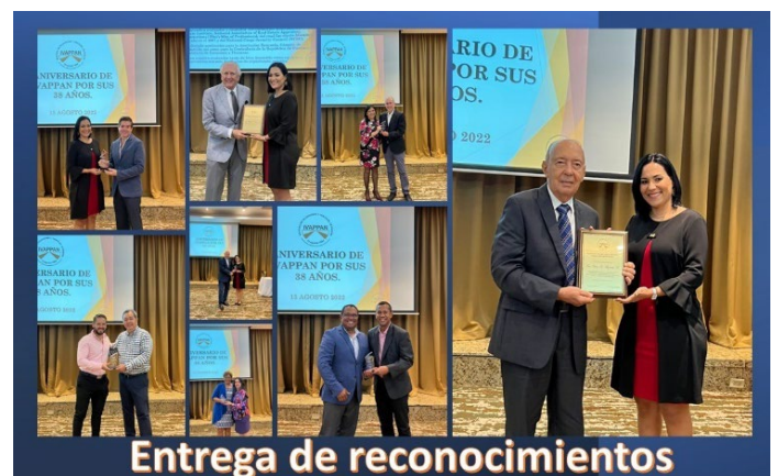
Entrega de reconocimientos

Todos contribuyendo a un crecimiento sostenido, con logros importantes